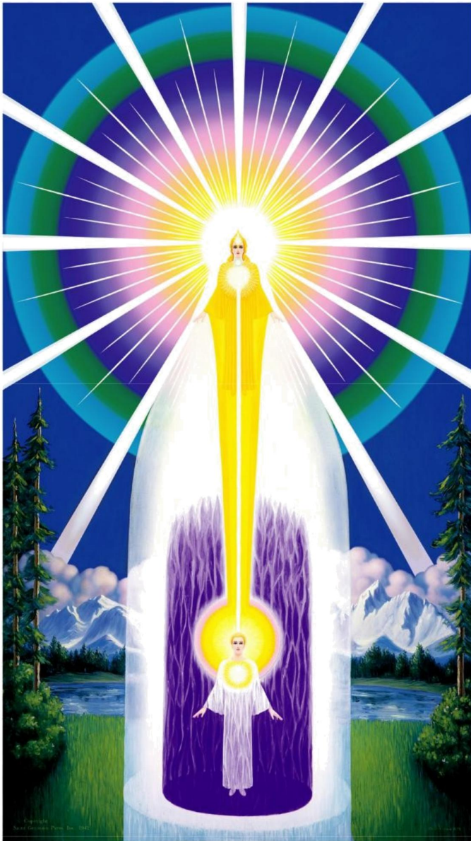
The Magic Presence